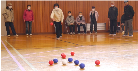
【ポッチャを楽しむ会員の皆さん。一投ごとに歓声が】

18名が参加、4チームに分かれて競技を楽しむとともに親睦を深めました。一投ごとに歓声が上がリ、冬の健康維持には良い運動になったものと思います。