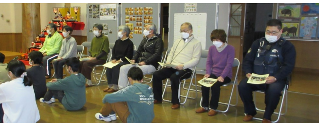
【出席した見守り隊の皆さんと羽田駐在所長】