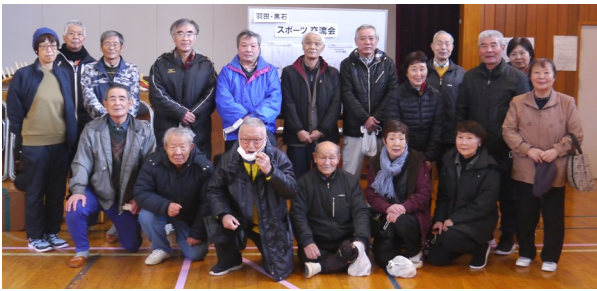
【シニアスポーツ交流会に参加した皆さん】

来年は羽田地区センターでの開催を予定しており、再会を楽しみに互いの健闘を讃え合っていました。お疲れ様でした。