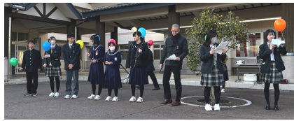
【バルーンリリースを進行するリーダー達】