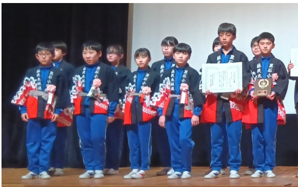
【黒石小学校蘇民太鼓の皆さん】