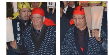
【夏参り先頭を務める檀家のお二人】