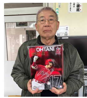
【切手セットを手に】

奥州市立黒石小学校卒業証書授与式 令和6年3月15日(金) 奥州市立水沢南中学校卒業証書授与式 令和6年3月13日(水)