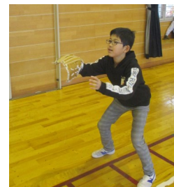
【キャッチボールを楽しむ児童】