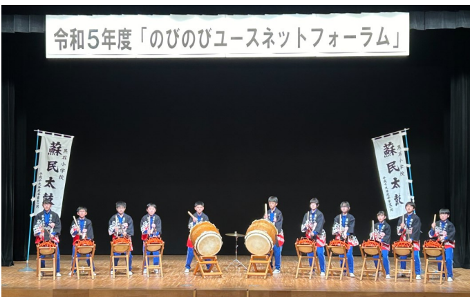
【さわやか賞を受賞した黒石小学校蘇民太鼓が披露される】