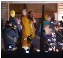
【住職から賞状授与】