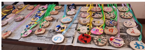
【作製された木メダル】

寺子屋リーダー木メダル作り 親子ジャンボかるた大会に向けて 令和6年1月14日(日)に開催予定の「黒石親子ジャンボかるた大会」に向けて、12月10日(日)、黒石地区センターに中高生の寺子屋リーダーが集まり、かるた獲得者に送られる木メダルとジャンボかるた2枚を作製しました。