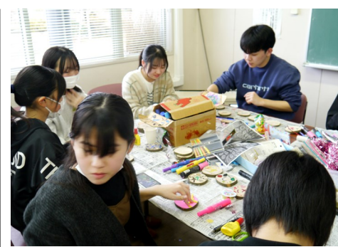
【一つ一つ丁寧に木メダルを作製するリーダー】