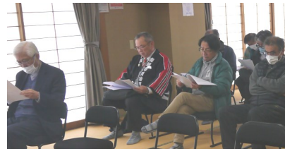
【説明を聞く総会出席者】

この後、短縮案の内容に基づく令和6年事業計画案及び予算案が審議・承認されました。