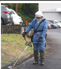
【黒石まつり会場清掃】