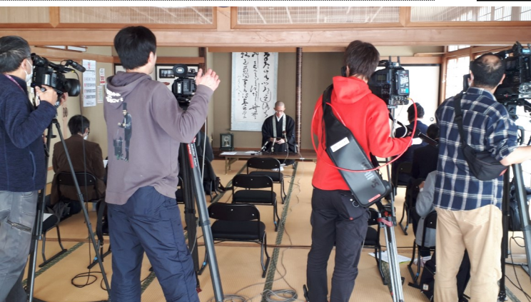
【テレビや新聞等多くの報道機関が詰めかけ取材】