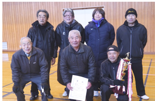
【優勝した高清水支部の皆さん】

参加は2支部だけでしたが、年間総合優勝を争う支部同士の対戦ということもあり、熱い戦いが繰り広げられました。結果は次のとおり 〈優勝〉高清水 〈準優勝〉鶴城