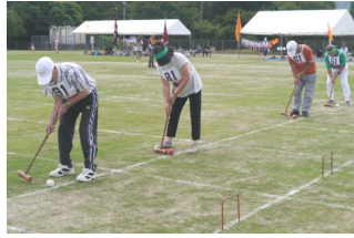
【ゲートボールリレー】