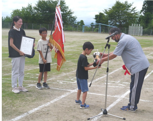
【優勝旗・優勝カップは長根に】