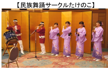
【民族舞踊サークルたけのこ】