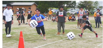
【サイコロ運試しリレー】