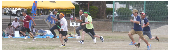
【支部対抗混合ジャンボリレー】