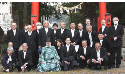
【祭典を担当した「下柳地区祭典委員会」の皆さん】

今年度はコロナ禍後初めて拜殿で神事を行うことができた、春の澄み渡る青空の下、平和と安全を、そして新型コロナウイルスの終息を併せて祈願いたしました。