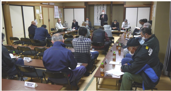
【4年ぶりに開催された総会の様子】