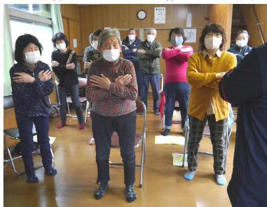
【いきいき百歳体操に取り組む正法寺行政区の皆さん】