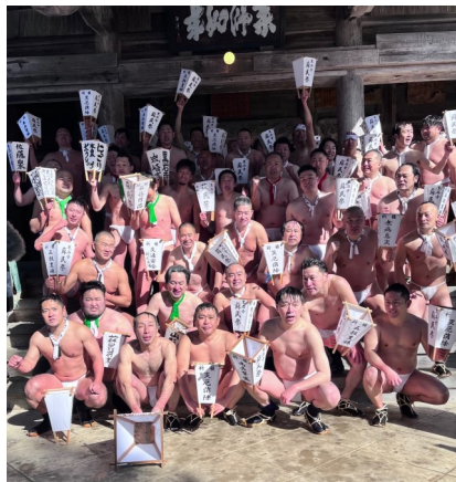
【夏参りを無事に終えた参加者たち】