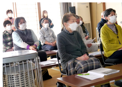
【熱心に聴講する受講生の皆さん】

その後、奥州市地域包括支援センターの職員から、エンディングノート活用の仕方についての説明があり、22名の参加者は、自分自身の今後について考えさせられる講座となりました。