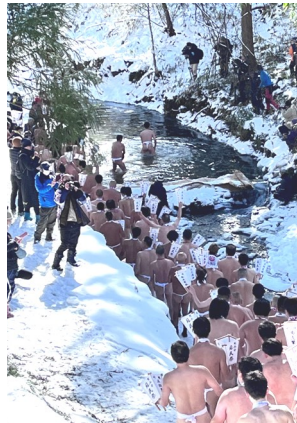
【瑠璃壺川へ向かう男衆】