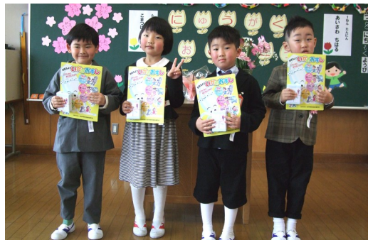
ちばしろうくん (二渡) ちばかえでくん (鶴城) ちだかなちゃん (小黒石) あへろくくん (二渡)